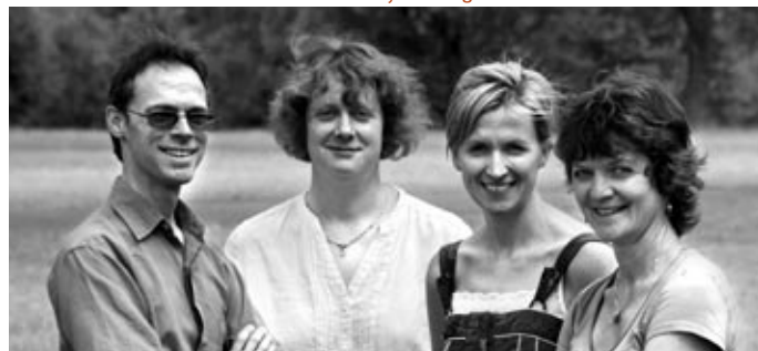
The Revolutionary Drawing Room

Sendung WDR 3 Do., 29. 12. 2011, 20:05, WDR 3 KONZERT